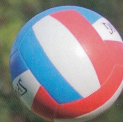
台南女中 侯昕宜 P.4

主動爭取、不怕開口 累積豐富國際學習經驗 城市小姐亞軍劉宜欣 海外實習增進獨立思辨力 P.48