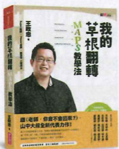
我的草根翻轉：MAPS 教學法 王政忠著／親子天下出版