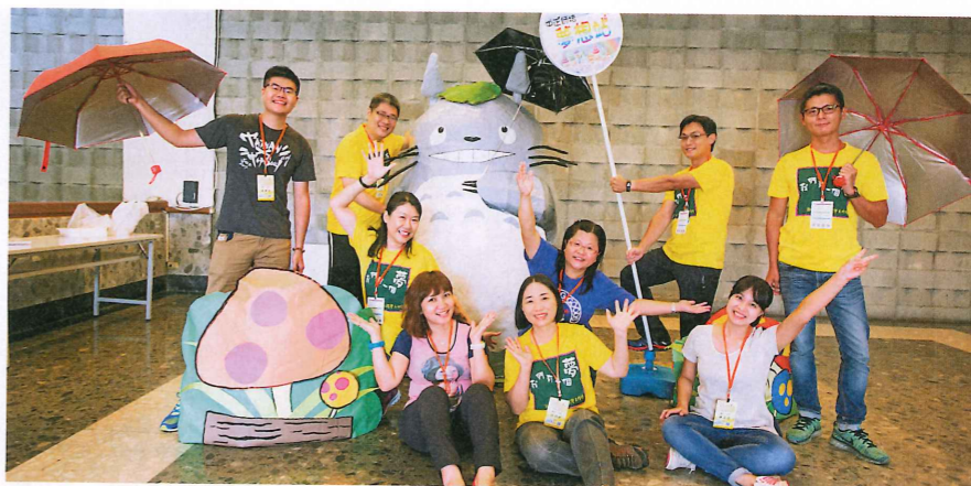
●夢二國中英文組 講師熱情有勁，大 方分享教學撇步。

所以不孤單；因為有對話，所以思考能夠更加豐富多元；因為有源源不絕的能量支持，所以老師們更加精進而專業。」