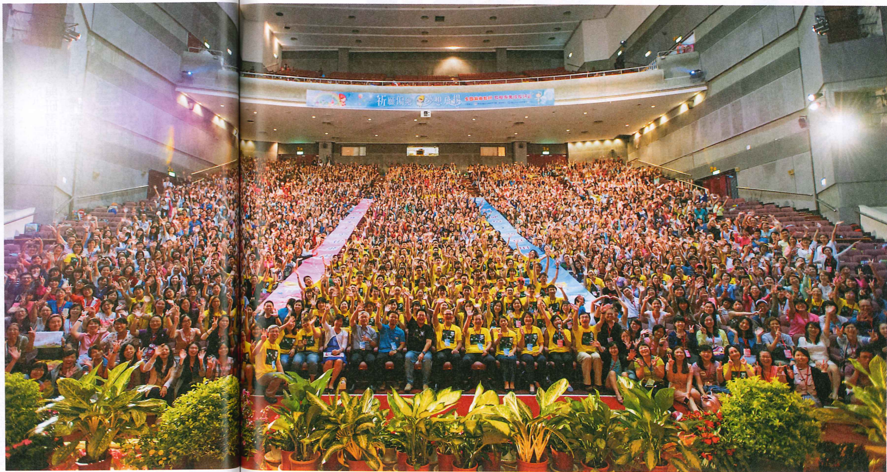
● 第二屆「我有一個夢」教師研習，成功號召 2,500 人共襄盛舉。

這些老師，為什麼這麼積極想要參與自主性研習？因為時代變化太快，過去所學已不夠用，再加上學生的特質與需求也日益多元化，迫使老師們想要尋求更有效的教學方法。