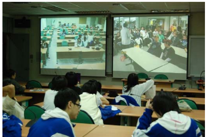
圖四：臺北市大直高中學生參與「全球多元文化傳統專題」學習計畫，與國外學生線上即時對談。

一般學校的作法是全班在大會議教室，利用一些簡單好用的視訊會議軟體（如：JoinNet 或 NetMeeting）在一台電腦主機上，架設好攝影機拍攝全體，把電腦銀幕投影至大螢幕上或傳輸到電子白板上，全班都可以和對方學校團體對談，以解決多人多台電腦同時上線，影響影音傳訊的效能。同時，這樣更有團體會談的氣氛，增加臨場感受。例如，2008 年臺北市有六所高中、國中、國小參與「全球多元文化傳統專題」的跨國學習計畫（Global Multicultural Heritage Project, GMHP） [8] ，和美、日、中國大陸等國學校以英語分享在地傳統文化，下圖四即為跨國即時同步對談的場景。