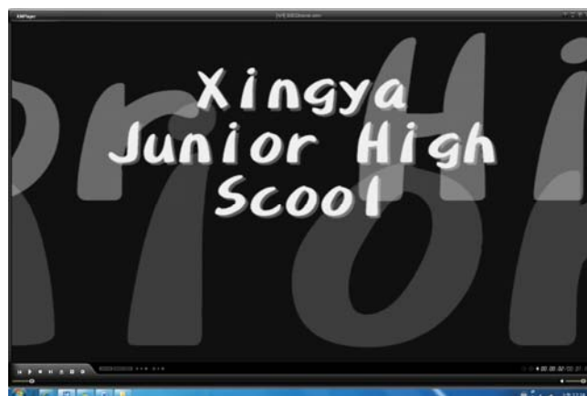
圖二：學生用 Microsoft Movie Maker 的字幕特效製作介紹興雅國中的短片。

還有學生發揮筆者所教的 Microsoft Movie Maker 應用練習，製作簡易電影，結合英語歌曲與班級照片，打上英語字幕介紹班級特色，作品令人激賞，而該生也因此學會了一首英語歌曲 (圖二)。