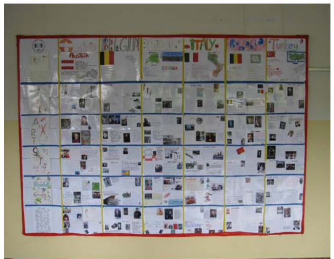
圖五：維也納雙語中學學生專題學習作品集：Global Dignity Day。

這樣簡便方式，筆者在美國波士頓研習、在歐洲參訪雙語教學時，都曾在中學現場看見同樣的場景。2008、2009 年筆者隨臺北市教育局赴歐洲參訪，不少中學的外語教師透過歐洲聯盟（簡稱歐盟，European Union, EU）轄下或相關的教育組織，跨國合作，進行跨文化專題學習。